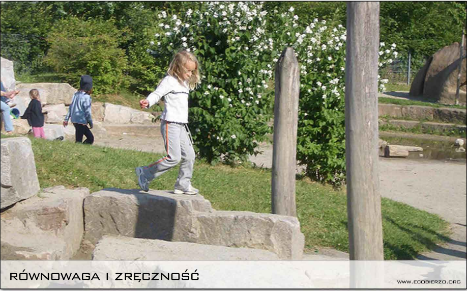
RÓWNOWAGA I ZRĘCZNOŚĆ