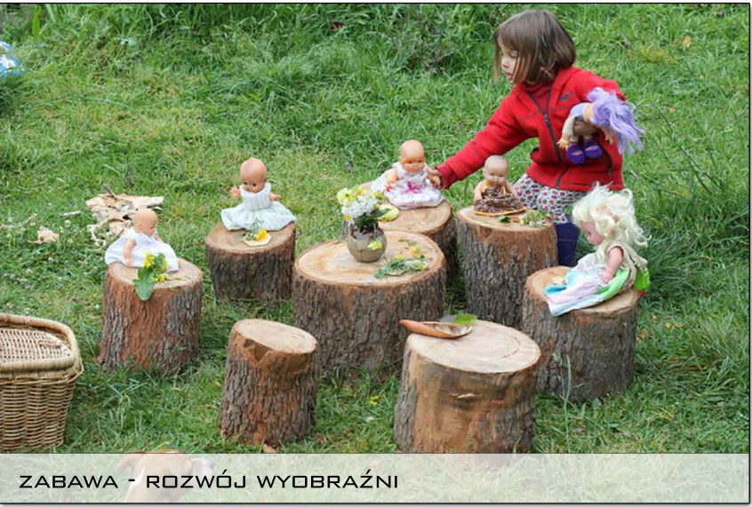
ZABAWA - ROZWÓJ WYOBRAŹNI