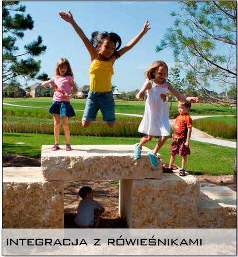
INTEGRACJA Z RÓWIEŚNIKAMI