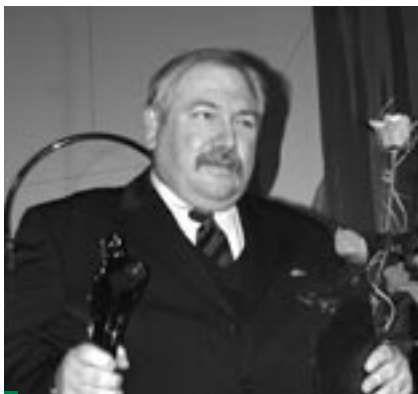
...w dziedzinie gospodarki Przedsiębiorstwo Budowy Dróg