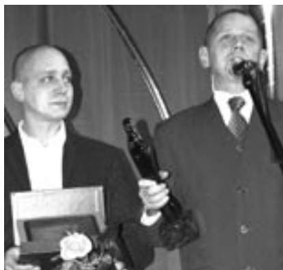
...w dziedzinie kultury Teatr „Kuznia Bracka”