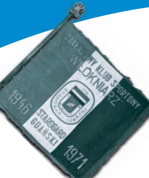
Sztandar klubowy Włókniarza