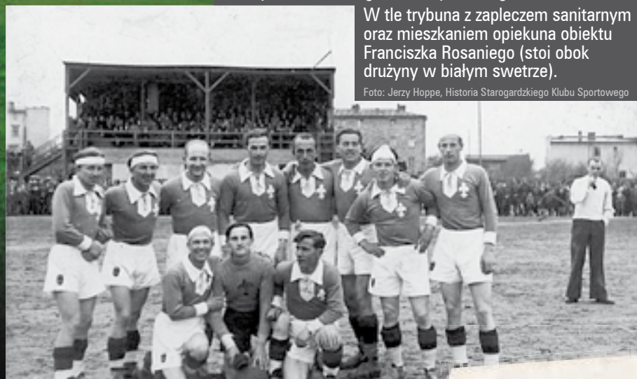
Drużyna ZKS Włóknierz, lata 60-te.