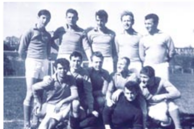
Drużyna ZKS Włókniarz przed meczem z Polonią Gdańsk w rozgrywkach Ligi Okręgowej. 16 maja 1965 r.