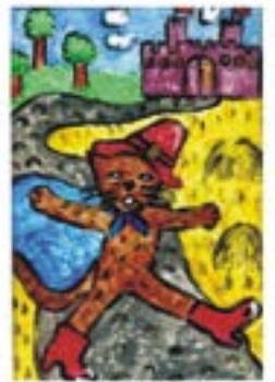
Albert lat 7, P N "PLASTUS" Starogard Gd.