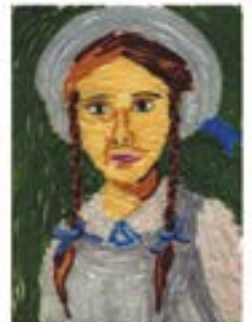
Lilka lat 13, PSP nr 2 Starogard Gd.