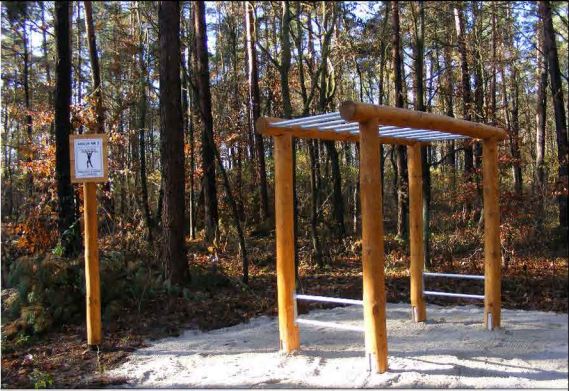
PRZEJŚCIE W ZWISIE PO DRABINIE