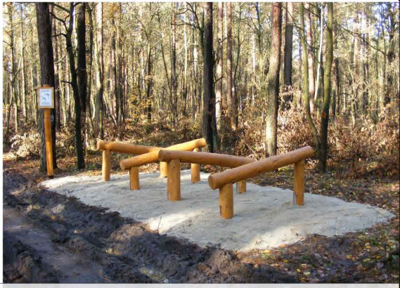
PRZECHODZENIE NAD I POD PŁOTKAMI