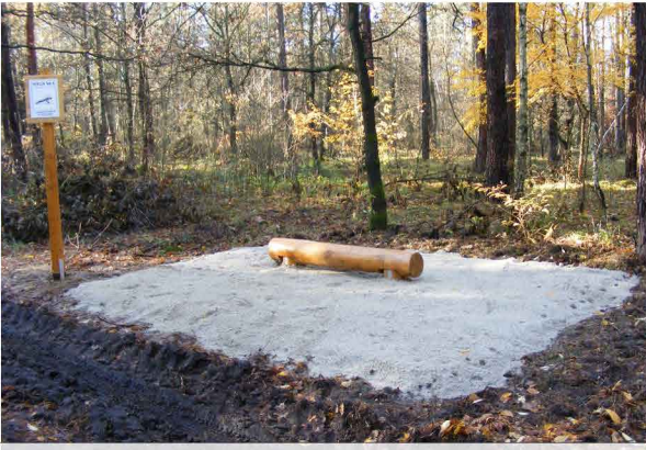
UGINANIE RAMION NA PODPORZE