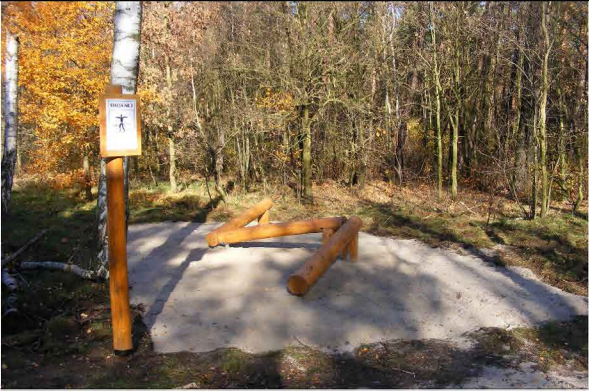
PRZEJŚCIE PO RÓWNOWAŻNI