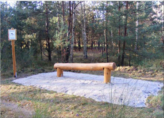
PRZESKOKI NAD PRZESZKODĄ