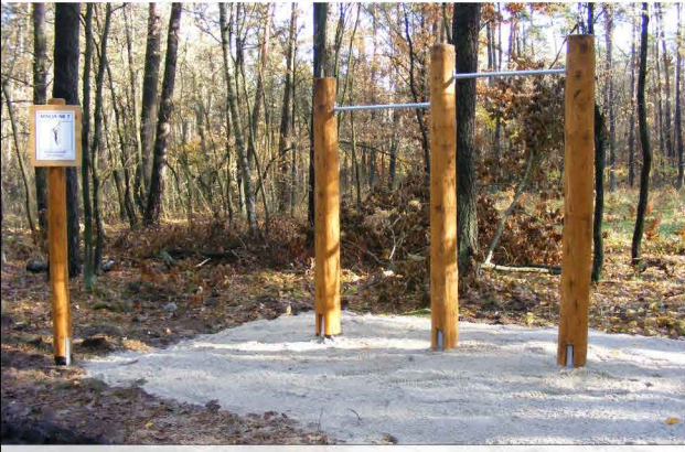
PODCIĄGANIE NA DRAŻKU