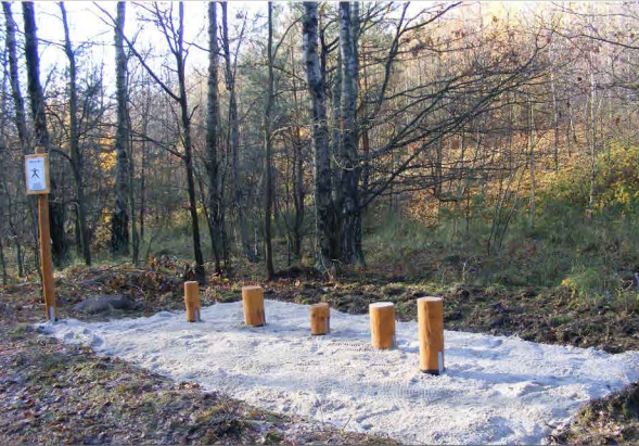
PRZESKOKI ROZKROCZNE NAD PALIKAMI