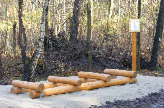
PRZESKOKI OBUNÓŻ NAD PRZESZKODĄ